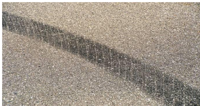
图 A. 4

车辆轮胎受制动力或碰撞冲击力或转向离心力的作用，偏离原行进方向相对于地面作横向滑移运动时，留在地面上的印迹。侧滑印特征为印迹宽度一般大于或小于轮胎胎面宽度，一般不显示胎面花纹，有时可能出现一组斜向排列的平行短线状印迹。见图 A. 4。