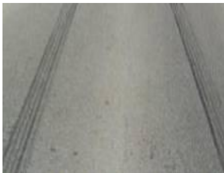
图 A. 3

拖印是指车辆轮胎受制动力作用，沿行进方向相对于地面作滑移运动时，留在地面上的印迹。拖印特征为带状，不显示胎面花纹，宽度与胎面宽度基本一致。拖印方向与车辆行驶方向基本一致，有时也会因制动跑偏或外加力矩的影响而有所偏离。见图 A. 3。