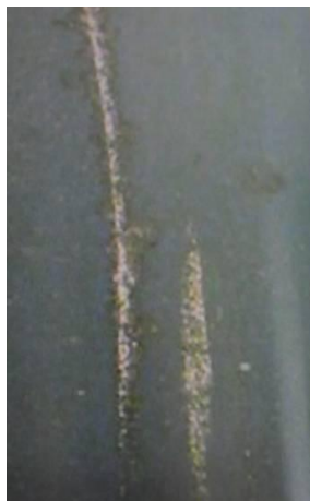
图 A. 5

挫划印是指硬物或其突出部分在路面上移动时，对路面造成的滚轧、刮擦印迹或沟槽。见图 A. 5。